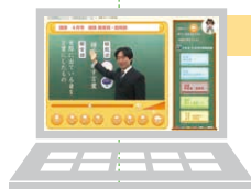
※パソコンはつきません。