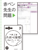
▲中学受験合格可能性判定プレテスト ※提出式ではありません。