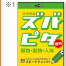
▲ズバピタ理科 植物・動物・人体