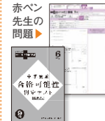
▲中学受験 合格可能性判定テスト ※提出式ではありません。