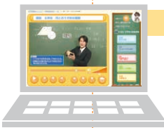
※パソコンはつきません。