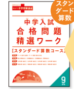
▲合格問題精選ワーク